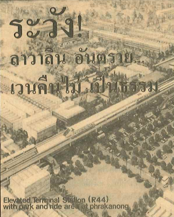
Elevated Terminal Station (R44) with park and ride area at phrakonong

ระวัง! ลาวาลิน อันตราย... เวนคืนไม่ เป็นธรรม